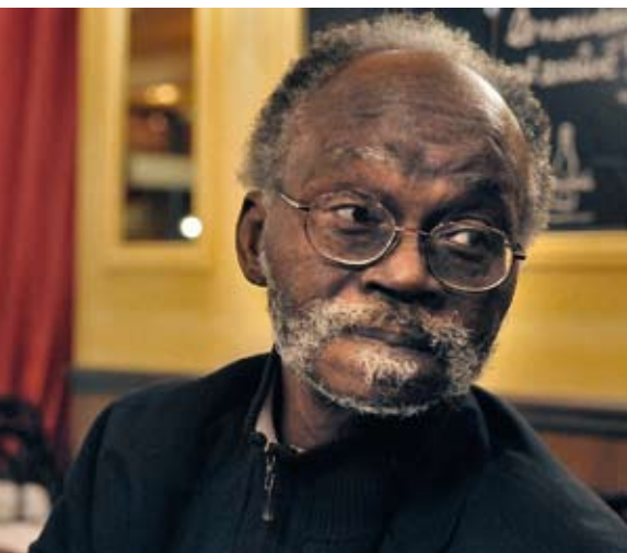
Valentin-Yves Mudimbé lors du colloque Violence et Vérité , Paris, 2008.

d'écrivains et des archives audiovisuelles, qui témoignent des rapports privilégiés entre les AML et des écrivains de l'Afrique centrale (Paul Lomami Tchibamba, Charles Djungu-Simba, Mwepu Mwamba, Antoine Tshitungu Kongolo, Pie Tshibanda, Tito Isuku Gafudzi, José Tshisungu wa Tshisungu, Kama Sywor Kamanda, Kompany wa Kompany, Zamenga Batukezanga...). Ce fonds dispose ainsi :