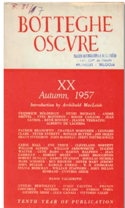
Le numéro XX de la revue Botteghe Oscure , Rome, automne 1957. Doc AML

- En matière de langues non latines , on signalera de belles collections de livres russes ou finlandais, des revues slovaques, etc. Une belle amorce de fonds international en matière de science-fiction se trouve également dans cette section.